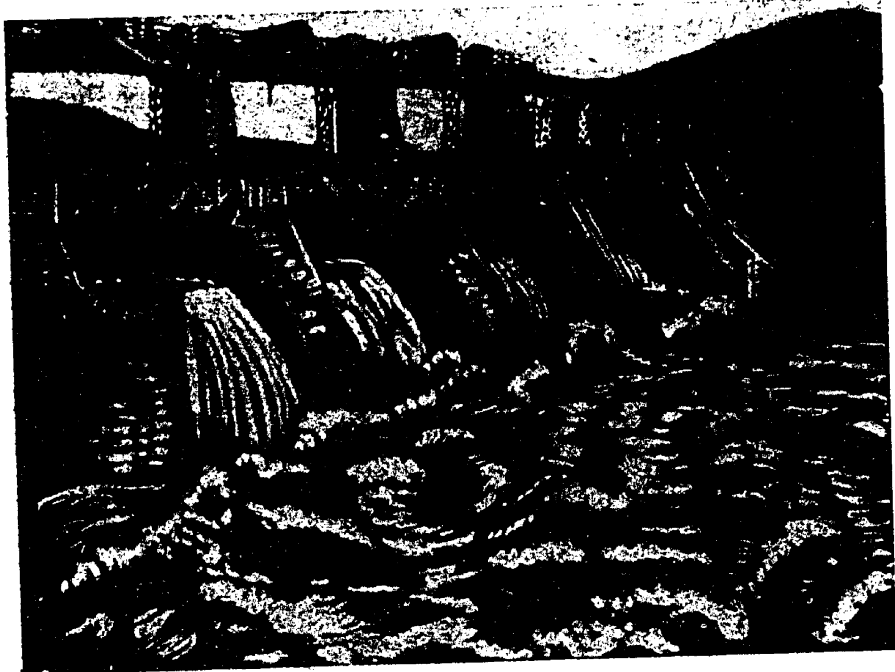
זעמא-אוטשאלער היראָ-עלעקטרישע סטאנציע אף קאווא

קערפערל וואלט דערפון איינגעדארט און איינגעהויקערט געווארן. דו וואלסט ניט אויסגעוואקסן, נאר פארוואנדלט געווארן אין א קאר- ליקל, א קריפל. דערנאך וואלט מען דייך פון קעסטל ארויסגעלאזט און אוועקגעשטעלט נעבן א נארמאל אויסגעוואקסענעם מענטשן. אייך ביידן וואלט מען געגעבן איין און דיועלבע ארבעט צו טאן